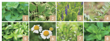
1. ツボクサエキス 2. イタドリ根エキス 3. オウゴン根エキス 4. カンゾウ根エキス 5. チヤ業エキス 6. カミツレ花エキス 7. ローズマリー葉エキス 8. セイヨウハッカ葉エキス (すべて保湿・整肌成分)

強い紫外線やエアコン、日差し、マスク擦れによって乾燥がおこりやすい肌環境を考慮し、潤いをさらに追求。水分・油分のバランスが整った潤いと、すこやかな肌をサポートする8種類*5の植物由来成分を加え、保湿力を格段にアップ*2。よりみずみずしい潤いに満ちた肌へ仕上げます。